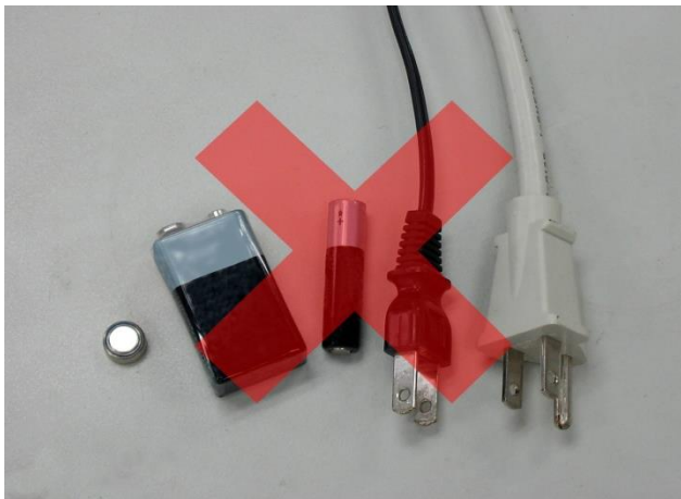
需使用電力的工具