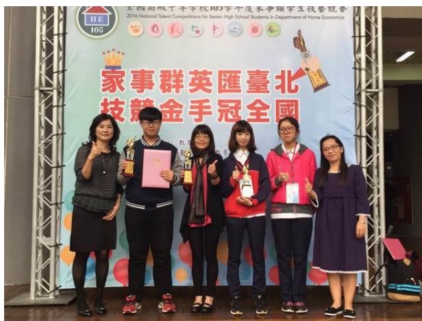
校長與家事類科主任指導老師及 選手合影留念