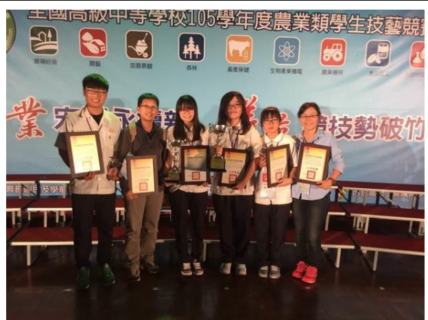
農業類科獲獎選手合影留念