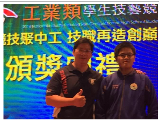
汽車科獲獎指導老師與選手合影留念