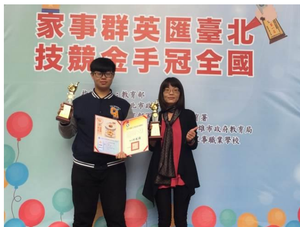
家業類科烹飪職種金手獎第一名