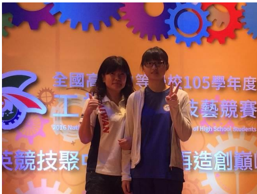
化工科獲獎指導老師與選手合影