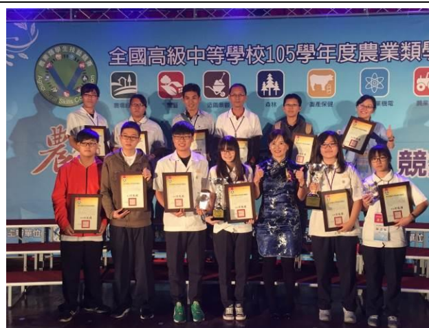
校長與農業類科獲獎選手合影留念