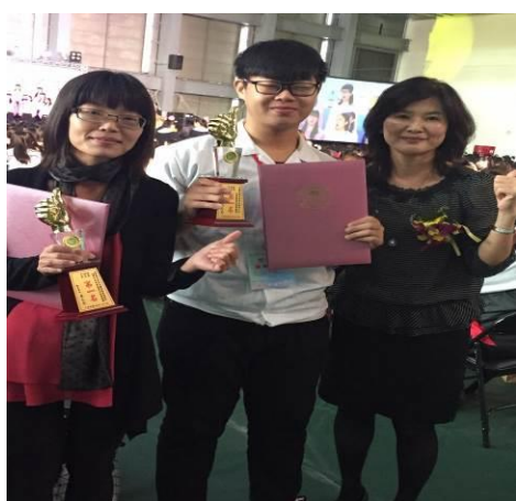
校長與家事類科主任及選手合影留念