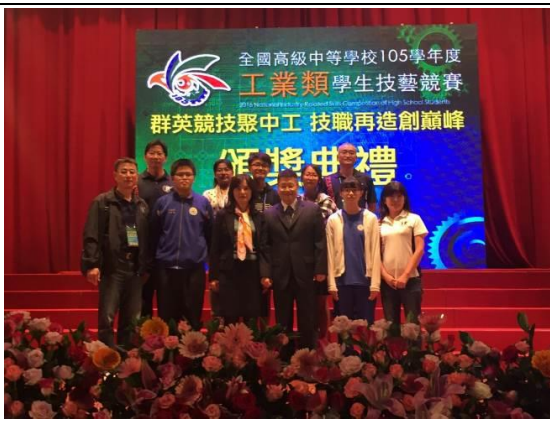
校長與獲獎選手指導老師合影