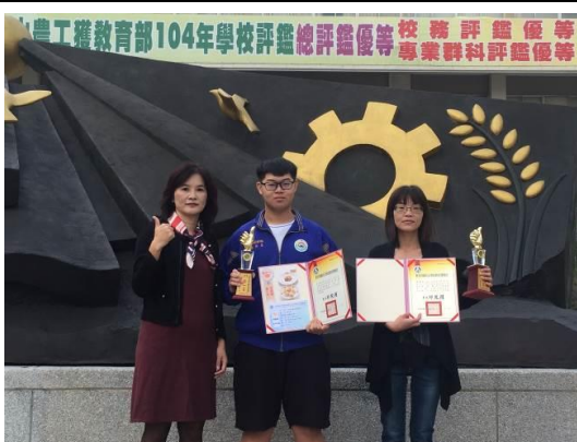
校長與家事類獲獎選手指導老師合影