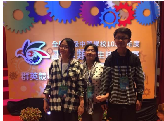
建築科獲獎指導老師與選手合影留念