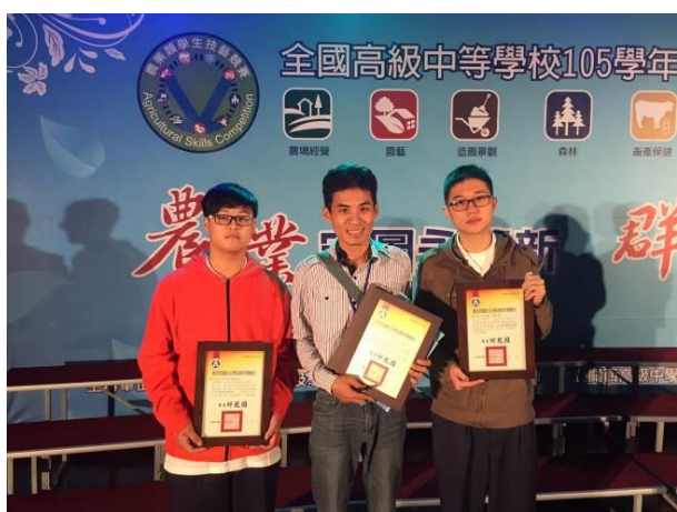
農業類科獲獎選手合影留念