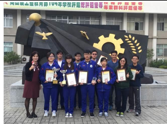
校長與農業類獲獎選手指導老師合影