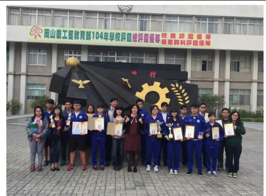
校長與獲獎選手指導老師合影