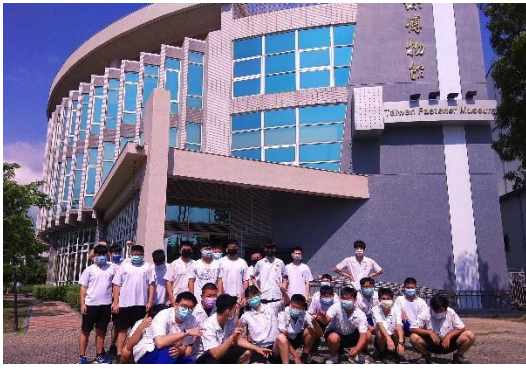
參觀校內螺絲博物館