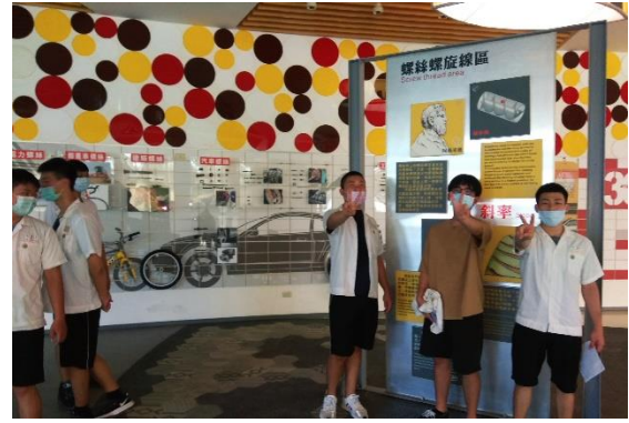
參觀校內螺絲博物館