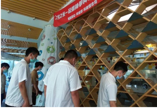
參觀校內螺絲博物館