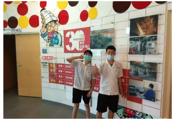
參觀校內螺絲博物館