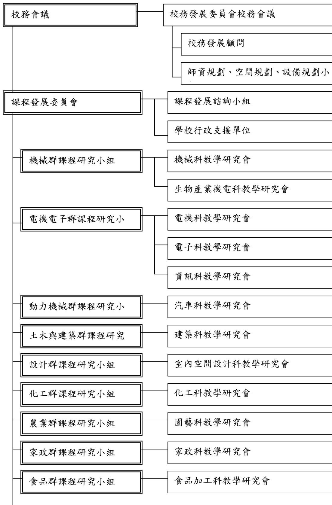
圖 1 課程發展組織架構圖