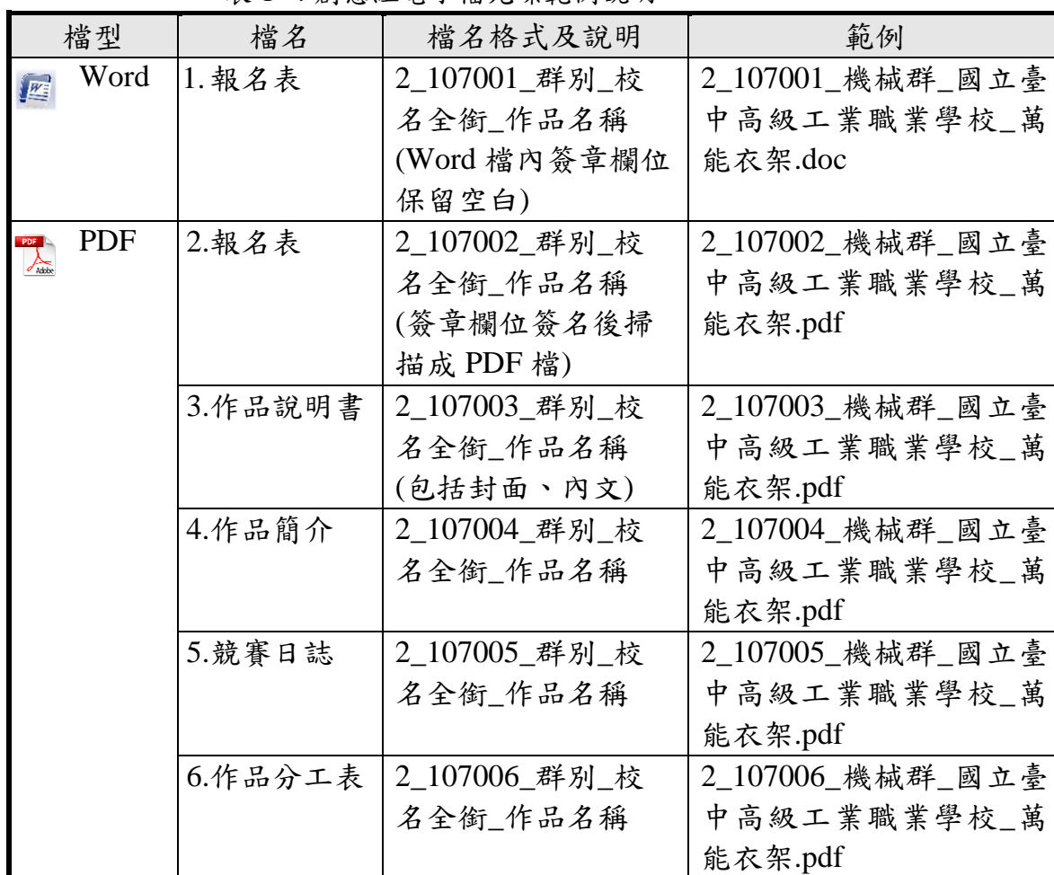
表 1-4 創意組電子檔光碟範例說明