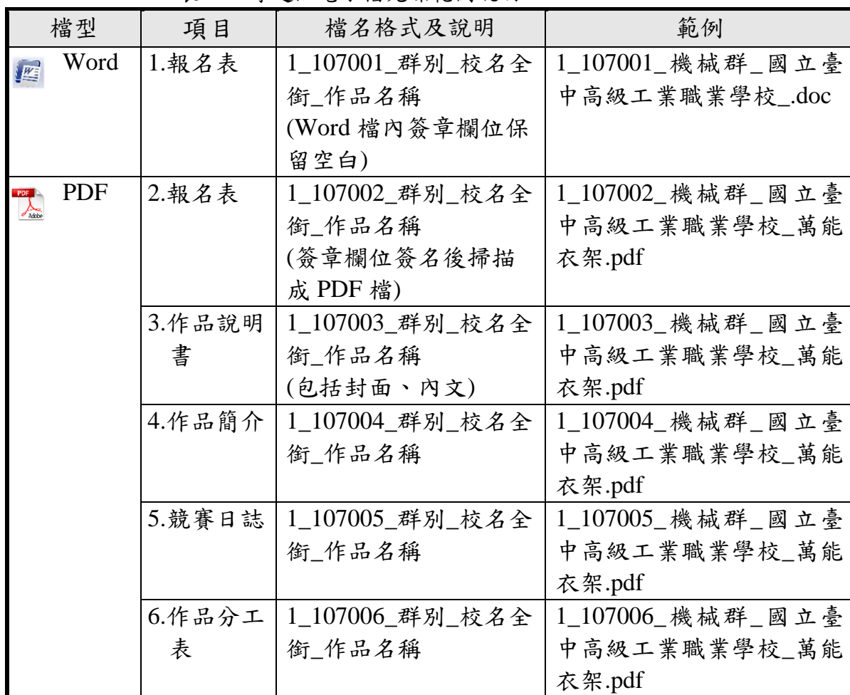
表 1-2 專題組電子檔光碟範例說明