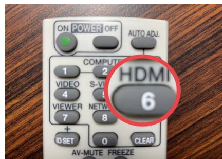
按 HDMI 鍵切換畫面