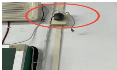
若網路不通可重插插頭