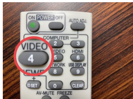
連按 2~3 次 VIDEO 鍵切換畫面