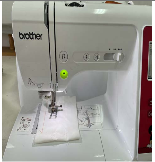
7. 將布料放在壓布腳下，將車針設置在縫紉開始位置