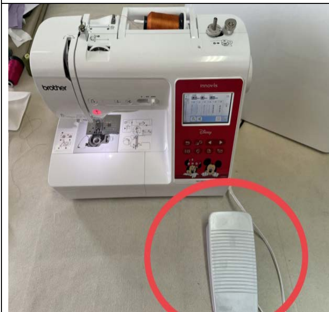
插入腳踏板後→慢慢踩下腳踏板→開始縫紉