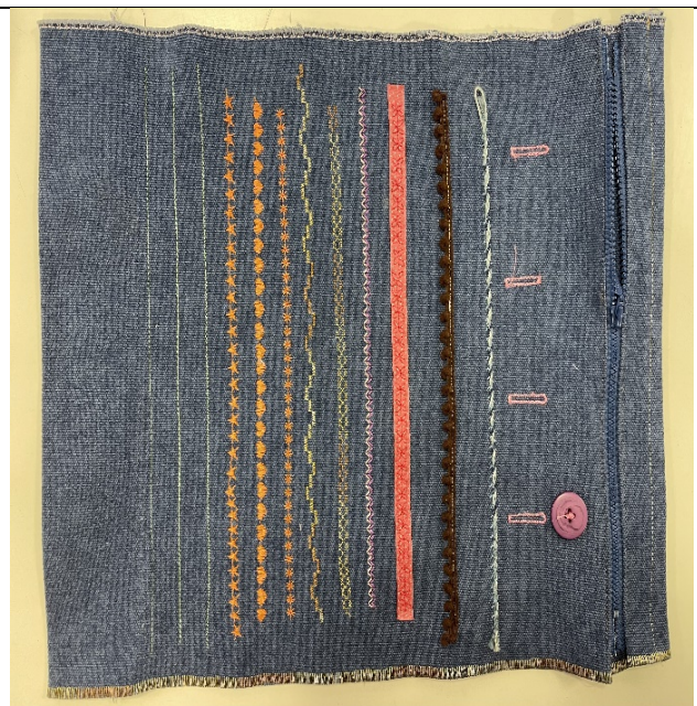
針趾及壓腳多種功能所車出的成品